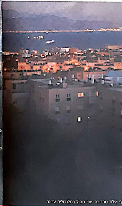
נוף אילת מהרירה. יופי מהול במלנוכיה עדינה

עמוס, ובו רב הסמיו על הגללה. אחד הדברים שחשובים לי בשלב זה של חי הוא לחיות קרוב למקור מים. בישראל יש בעיקר ים, ואני חיב לחיות קרוב אליו. החשיבות היא לא רק בהזרמת הדם והזזת הגוף למען עשיית ספורט. נפשי חייבת לפחות פעם ביום לשחות ולהרגיש הרבה מים. אולי זה רצון כמנס לחזור לרחם ואולי זה רק תגובה כימית של פירוק חומרים בכוח: זה כלל לא משנה. אני מכור לשחיה, זה מעניק לי תחושת שקט ושלווה פיזית. הים האדום הוא פינת טבע קסומה, רווית חיים, בלב המדבר הצחיח. את אילת הכרתי כתחנת מעבר בדרך לסיני. גם אני, כמו רוב הישראלים, הייתי עמוס בטסריטיסטים שליליים לגבי העיר ותושביה.